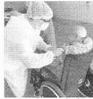
Idosos foram vacinados nesta semana