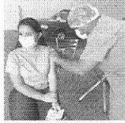
Funcionários do Reviver também foram imunizados