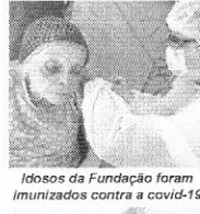
Idosos da Fundação foram imunizados contra a covid-19